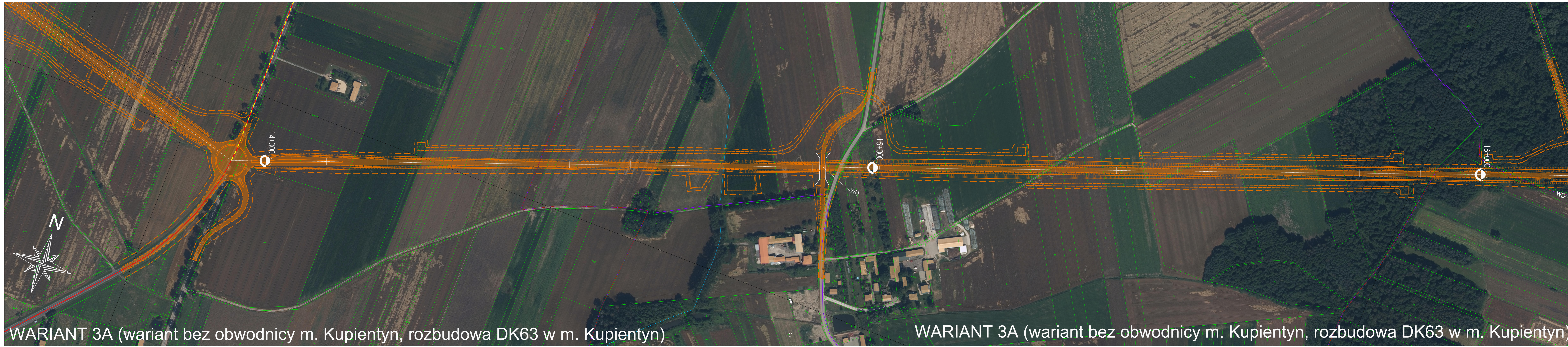
WARIANT 3A (wariant bez obwodnicy m. Kupientyn, rozbudowa DK63 w m. Kupientyn)